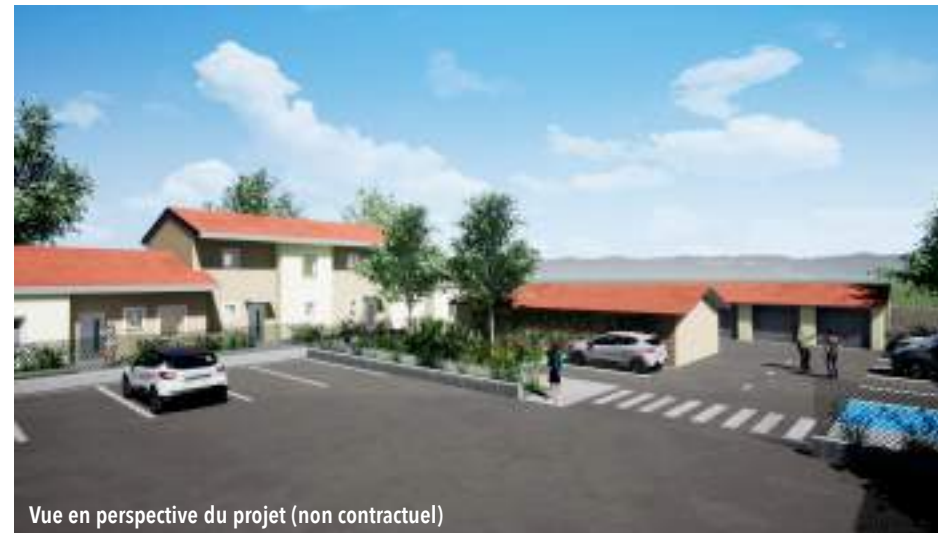
Vue en perspective du projet (non contractuel)